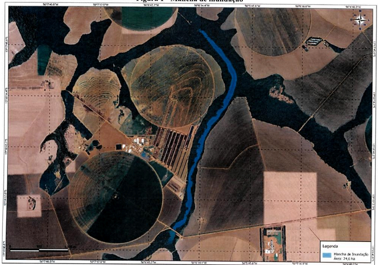
Figura 1 - Mancha de inundação